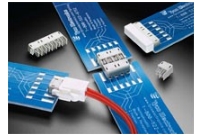
Hermafrodite connector serie